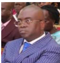
DRHP : DIRECTEUR DES RESSOURCES HUMAINES ET DU PROJET