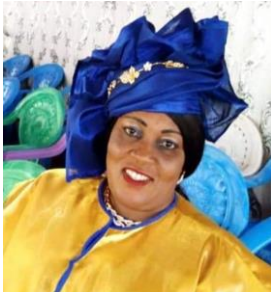
DAP : DIRECTRICE DE L'AGENCE PRINCIPALE