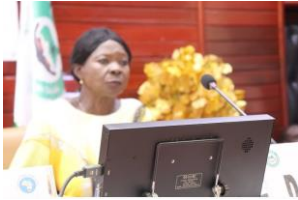
DSP : DIRECTRICE DES SERVICES PRESTATIONS