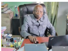
DFC : DIRECTEUR FINANCIER ET COMPTABLE