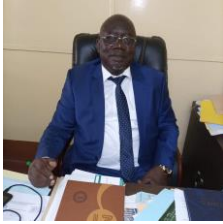
DPB : DIRECTEUR DU PATRIMOINE ET DU BUDGET