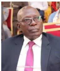
COORDONNATEUR D'AUDITE INTERNE