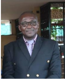
DRC : DIRECTEUR DE RECOUVREMENT ET DU CONTRÔLE