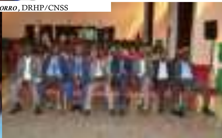
Vue partielle de l'assistance

moire de ceux « qui nous ont quittés », a-t-il témoigné et de solliciter une minute de silence.