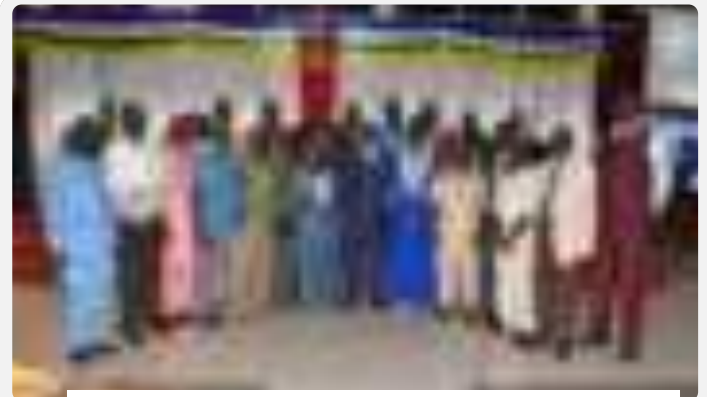
Le DG avec les Assurés sociaux

Il a saisi l'occasion pour exhorter le Directeur Général à être attentif « aux différentes audiences introduites par le personnel retraité » puis, il a demandé « aux collaborateurs en activités d'appuyer sans réserve le Directeur Général dans ses missions afin de porter le renom de l'institution ».