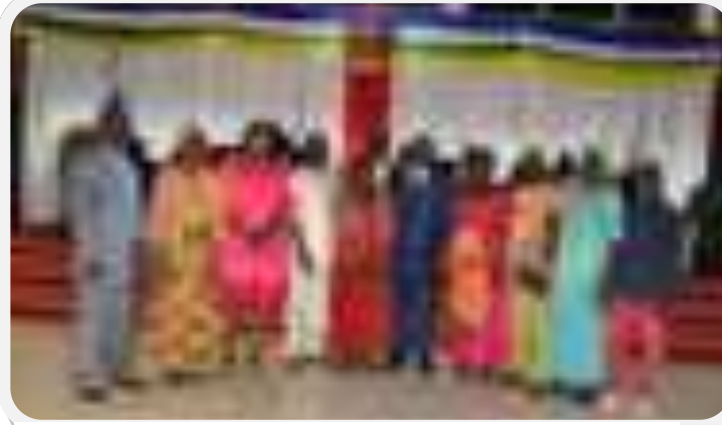
Le DG avec le personnel retraité de la CNSS