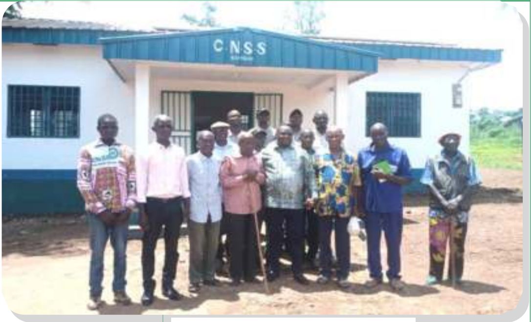
Photo de famille à Bambari

Enfin, le Directeur Général a réitéré sa volonté de pérenniser de telle visite dans les autres Agences Régionales de la