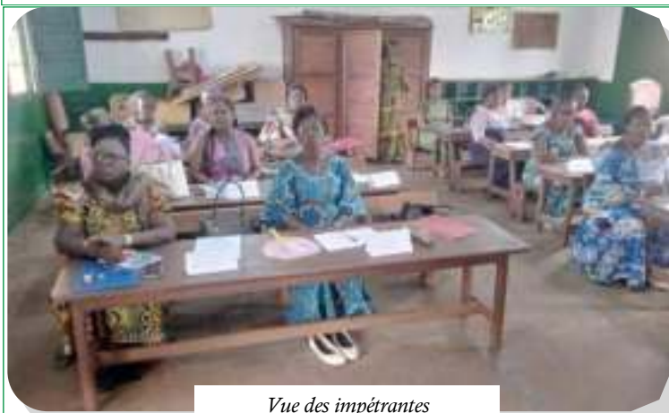
Vue des impétrantes

La Direction Générale de la CNSS ne ménage aucun effort quand il s'agit de renforcer les capacités intellectuelles de son personnel. Au programme cette fois-ci, vingt-et-trois Monitrices de l'Ecole Maternelle de la Caisse Nationale de Sécurité Sociale qui ont suivi une séance de recyclage tenue au sein de ladite Ecole, du 17 au 27 juillet 2024.