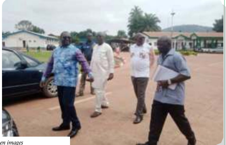
Visite en images

Egalement, les carrelages de certains bureaux sont défectueux et nécessitent une réhabilitation. Idem pour certaines toilettes externes réservées aux usagers qui ont besoin d'être rénovées, a relevé le Directeur Général qui a déploré le dépotoir de l'institution, mal entretenu et les meubles usés exposés en plein air présentant un décor malsain.