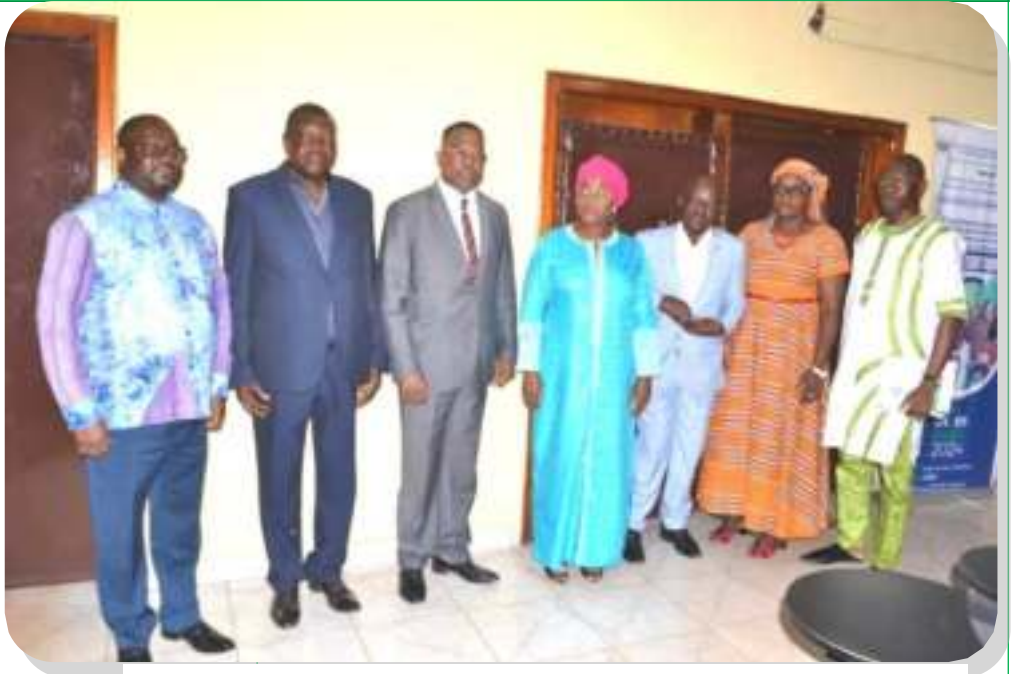
Photo de famille des nouveaux Administrateurs avec la Ministre de Tutelle et le DG de la CNSS