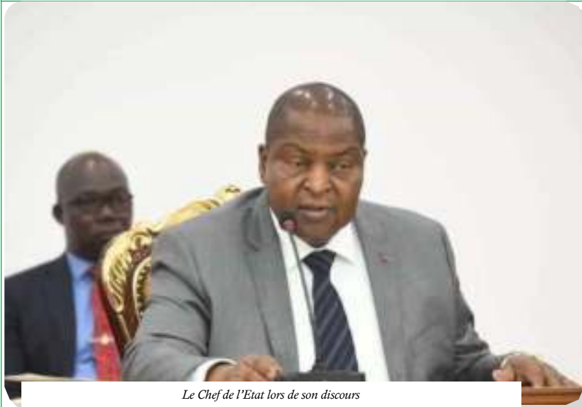
Le Chef de l'Etat lors de son discours

La République Centrafricaine, à l'instar des autres pays, membres de la CIPRES, s'est dotée, le 19 septembre 2024, de son premier Document Cadre de Politique Nationale de la Protection Sociale pour la période 2024-2028.