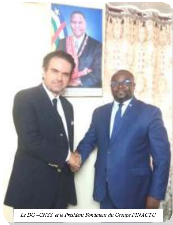
Le DG -CNSS et le Président Fondateur du Groupe FINACTU

Pour rappel, par voie d'appel d'offres, le Groupe FINACTU a réalisé en 2019, l'étude actuarielle du régime de sécurité sociale de la CNSS. Les conclusions ont permis à la Caisse d'équilibrer le financement de la branche de retraite.