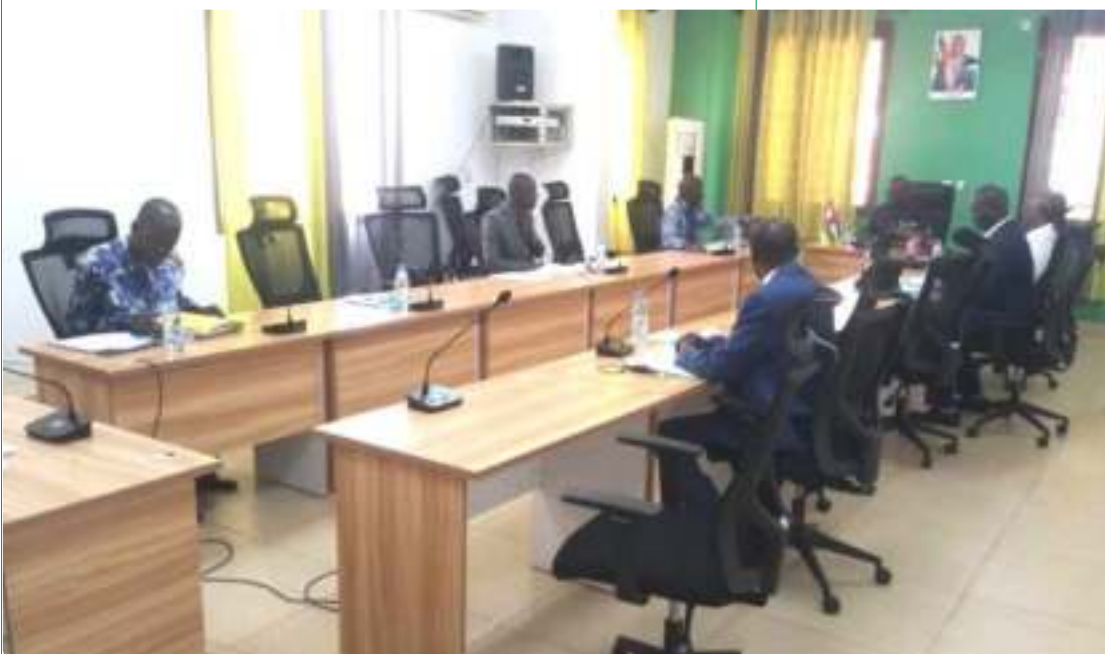
Vue de la salle du Comité

les comportements des travailleurs et sanctionner ceux qui s'adonnent aux conduites professionnelles déloyales et indisciplinées.