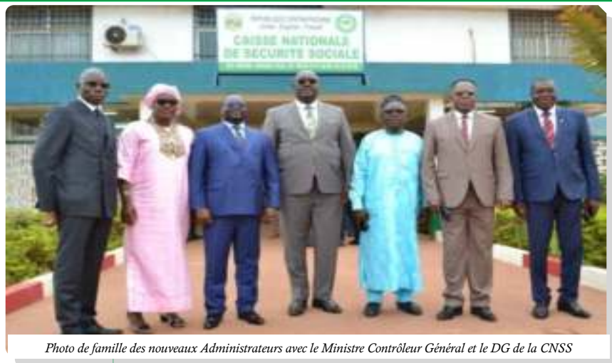
Photo de famille des nouveaux Administrateurs avec le Ministre Contrôleur Général et le DG de la CNSS