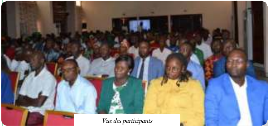
Vue des participants

Par ailleurs, les résultats des travaux de la Coordination de l'Inspection et d'Audit Interne de la CNSS mentionnent l'existence d'une longue liste des travailleurs indécents.