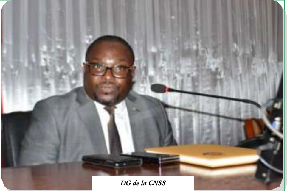
DG de la CNSS

le cumul des prêts par certains travailleurs, le trop perçu ou encore la minoration des salaires afin d'échapper aux paiements des impôts jugés trop élevés.