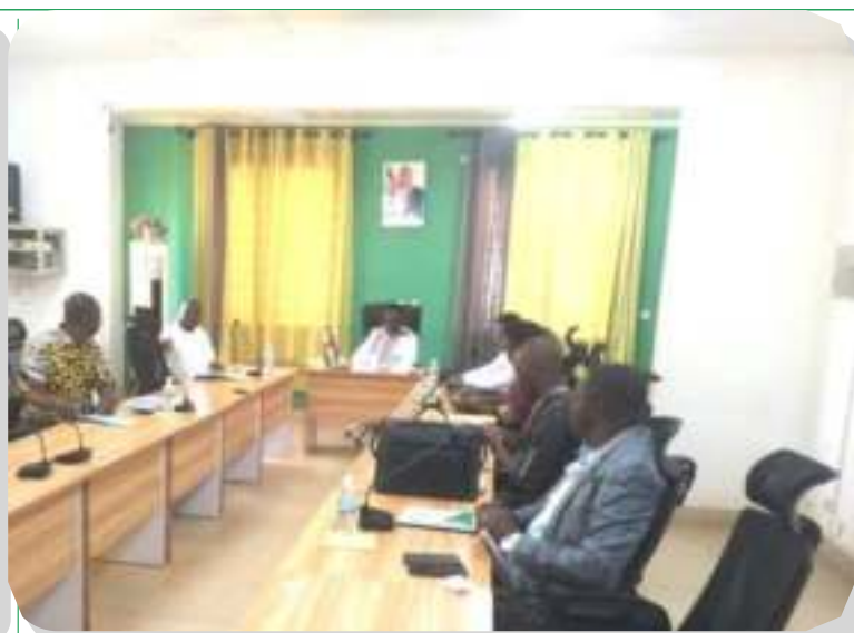
Vue de la salle de la session extraordinaire des Administrateurs

A u cours de cette première session, les Conseillers ont débattu des cinq (05) points inscrits à l'ordre du jour, à savoir :