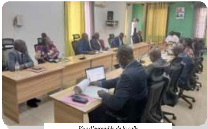
Vue d'ensemble de la salle